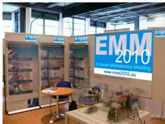
Exemples de présentation – photos non contractuelles

Liste des stands doubles : Stands n°11+10 ; Stands n°6+7 ; Stands n°3+2 Liste des stands doubles en angle : Stands n°20+15 ; Stands n°12+5 ; Stands n°18+17 ; Stands n°9+8